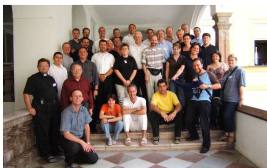
Studiedagen in Freising (D) september 2005

... CIM-studiedagen 2007: 10. 09. – 13. 09. in Oostenrijk